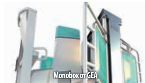
Monobox от GEA