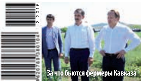
За что бьются фермеры Кавказа

«CLAAS держит курс на интернационализацию» интервью с региональным президентом концерна CLAAS Берндом Людевигом стр. 8