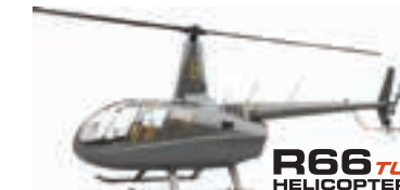
R66 TURBINE HELICOPTER