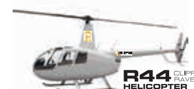
R44 CLIPPER RAVEN II HELICOPTER