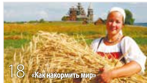
18 «Как накормить мир»