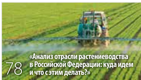
78 «Анализ отрасли растениеводства в Российской Федерации: куда идем и что с этим делать?»