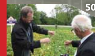
50 В Канаду – за опытом.