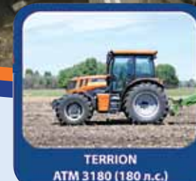
TERRION ATM 3180 (180 л.с.)