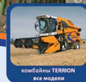
комбайны TERRION все модели