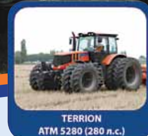
TERRION ATM 5280 (280 л.с.)